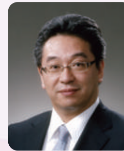
東北大学病院 外科専門医プログラム 責任者